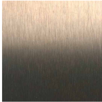
LIGHT BRONZE M99813V