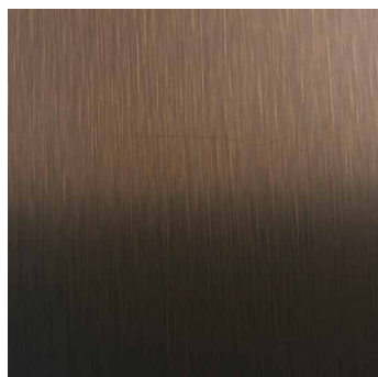
DARK BRONZE M99803V