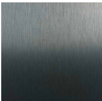
DARK GREY M99783V